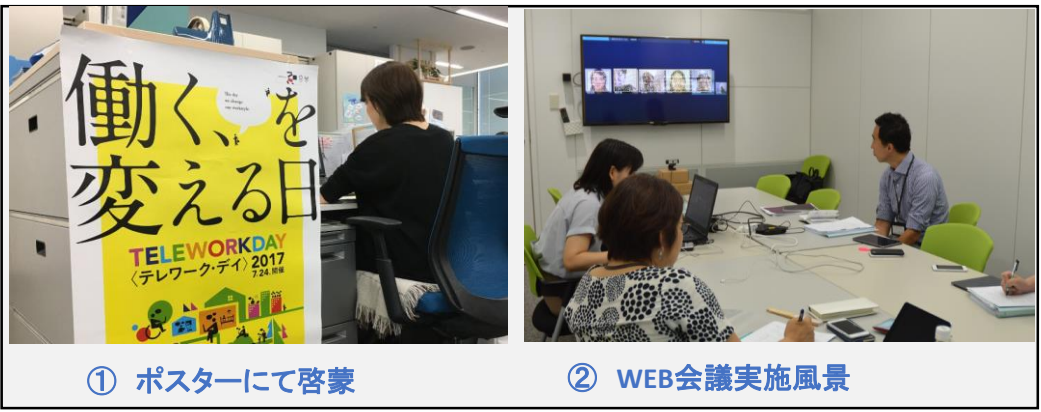
① ポスターにて啓蒙